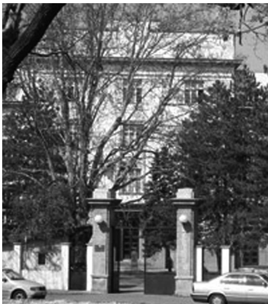
Adaptirana zgrada Arhiva Jugoslavije (glavni ulaz)

Sva dosadašnja iskustva govore da gradnja namenskog objekta ima mnogo prednosti u odnosu na adaptaciju postojećih ili nekih drugih već izgrađenih objekata.