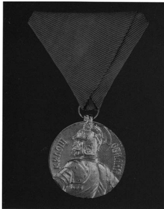
Zlatna medalja za hrabrost Miloš Obilić 1913.

Čovek koji je navodno dobro informisan ispričao je podnosiocu ovog rada da se u jednoj od država sa prostora bivše SFRJ pre četrdeset godina desio skoro neverovatan slučaj u vezi sa jednim odlikovanjem.