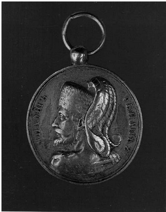
Medalja za hrabrost Miloš Obilić 1847.