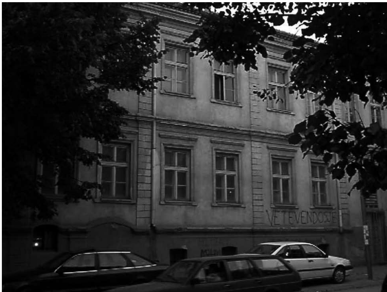
Arkivi i Qytetit të Prishtinë - Regional Archive of Pristina

Arkivi i Gjakovës është i vendosur në një kat të një ndërtesë – saraji të ndërtuar gjatë periudhës osmane. Tani i është ndarë edhe një kat i asaj ndërtesë, por nuk janë bërë kurrfarë adaptimesh, kështu që Arkivi nuk ka kushte të përshtatshme për zhvillimin e veprimtarisë së vet, deri sa të bëhen investime dhe adaptime të lokaleve për arkiv.