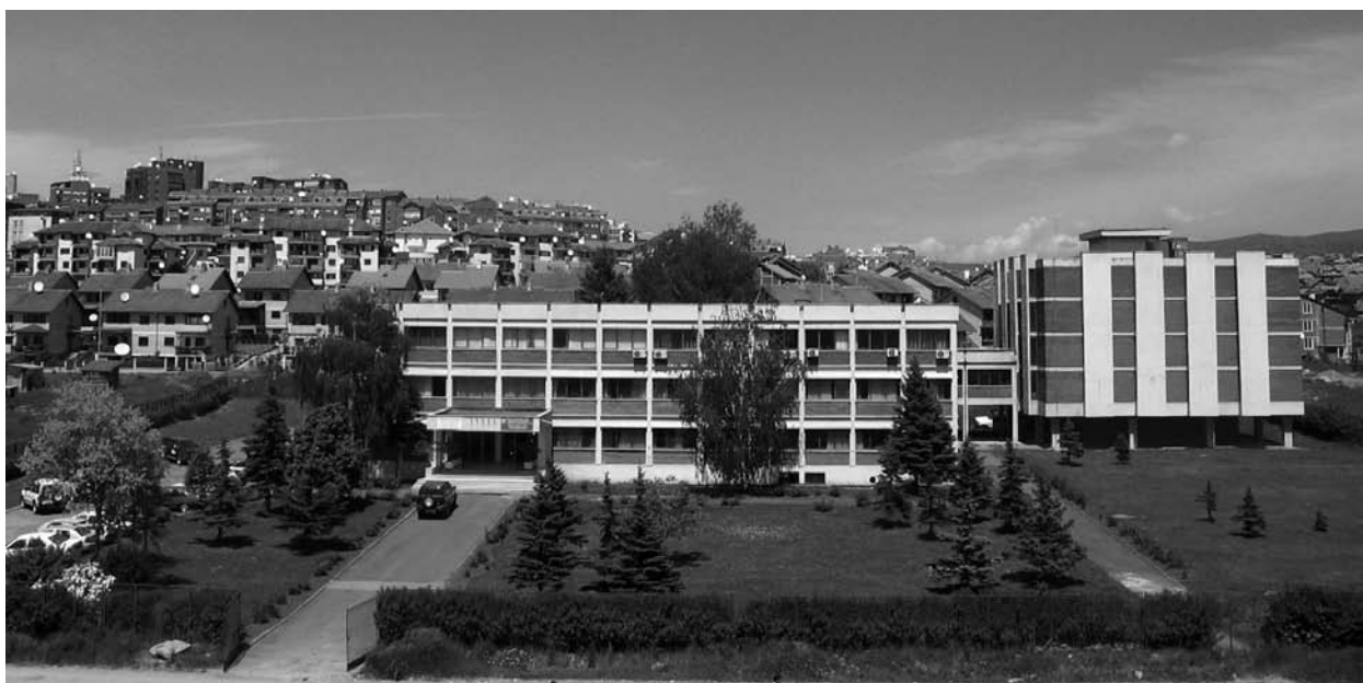
Agjencia Shtetërore e Arkivave të Kosovës - The State Agency of Kosovo Archive

Shërbimi arkivor në Kosovë është një ndër shërbimet më të reja në Ballkan dhe më gjerë. Kjo është reflektuar edhe në sigurimin e objekteve të arkivave. Një kohë të gjatë, por edhe sot në masë të madhe ndihet nevoja për objekte adekuate për arkiva.