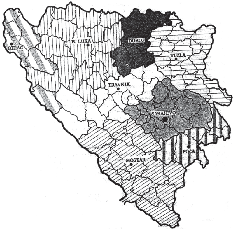
Prilog 1. Arhivska mreža u Bosni i Hercegovini do aprila 1992. godine (Azem KOŽAR, Arhivistika 1 , p. 33)

The transition of the Bosnian society is part of a variety of difficulties primarily of political and economic nature. Dayton constitution and other solutions are inadequate and the political consensus and national political structure does not yet exist to make the situation could change and improve. Thus, state circumstances and relations in society directly or indirectly reflect on the archival work and even the state archival legislation. Archival regulations are generally conservative, anachronistic, out of sync and unharmonized which significantly affects the status and achievements of archival activities in general. Archival work is divided. Positive examples of certain administrative units and levels can be found, as well as the enthusiasm of the majority of archivists, but it can not give the expected results in the long run, nor can they run a locomotive of change. They just flash and disappear and not yield the expected improvement. Archivists are called by profession and science, by archives and archival associations, with synergistic activity to change the situation for the better. Political obedient cadre should leave and allow creative archive staff to take the helm of the profession and science. High knowledge needs to find a place